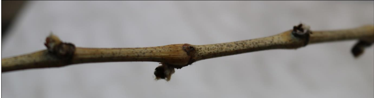
Slika 7: Sveže odrezane rozge so bile na površini tal tretirane s sladkorno raztopino ob vrednotenju poskusa najdene s popolnoma vsemi objedenimi brsti.

Posebnost izvedbe poskusa v letu 2017 je tudi izrazito intenzivno hranjenje gosenic na sveže odrezanih rozgah, ki so ležale na tleh (trsi so bili obrezani en dan pred izvedbo poskusa), zlasti na površini tretirani z 10% sladkorno raztopino. Tam so odrezanim rozgam gosenice v celoti poškodovale brste. Ta del poskusa je bil povsem nepričakovan in ga ni bilo mogoče statistično vrednotiti.