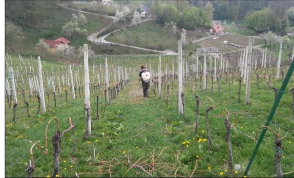
Sliki 3 in 4: Vinsko trto smo z namenom odvrčanja škodljivih gosenic sovk zaprašili z mešanico žvepla in apna, v medvrstnem prostoru pa smo za povečanje ješčnosti gosenic nanесли 10% sladkorno raztopino.

V zasnovi bločnega poskusa smo preučevali dva fiksna dejavnika in eno interakcijo (sladkorna raztopina (10%) nanescena na podrast med vrste (A); žveplo + apno posipano na trto (B); interakcija (A+B) in kontrola (K)). Poskus je imel tri ponovitve. Medvrstna razdalja: 2 m; razdalja med trsi v vrsti: 0,75 m; dolžina bloka v vrsti: —6 m; število trsov v vrsti bloka: 10; število vrst v bloku: 3; število trsov v bloku: 30.