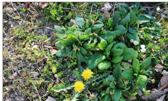
Sliki 1 in 2: Pogoje za poskusno parcelo je bil poraščen medvrstni prostor, z gostiteljskimi rastlinami rjavega, malega rumenega in bledega trakarja.

Pred izvedbo poskusa smo večkrat preverili pojavnost škodljivih gosenic in opravili preglede poškodovanosti brstov. Tik pred poskusom smo vse poškodovane brste po poskusnih parcelah prešteli in jih zabeležili. Predviden fenološki okvir za izvedbo poskusa je bil v času brstenja vinske trte, stopnja 03-13 po lestvici BBCH, kar se nam je uspešno izteklo. Predviden časovni okvir za izvedbo poskusa: marec / april pa je bil v vsakem letu določen na podlagi začetka zabeleženih poškodb brstov in se je zaradi muhastega vremenskega dogajanja (pozeba) v 2017 in 2018 zamikal na kasnejše datume.