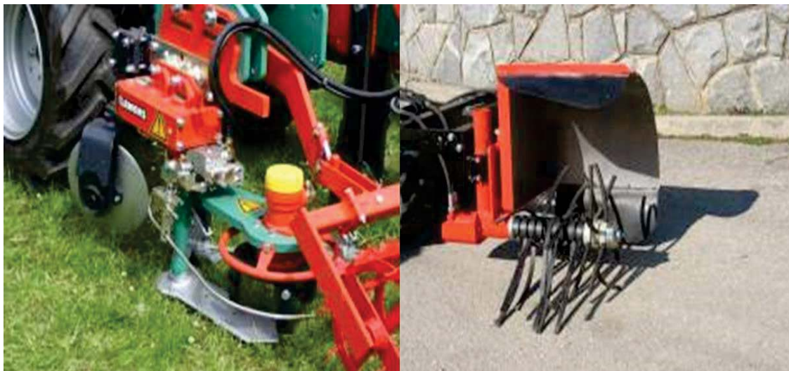
Slika 5: Podrezovalnik plevelov (slika levo) in prirejen pletvenik (slika desno) za mehansko zatiranje plevelov v vrsti