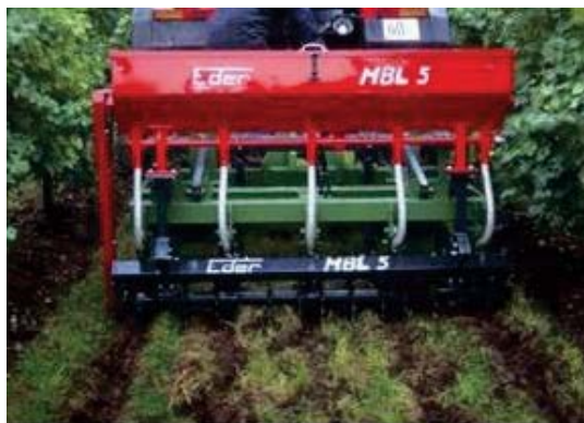
Slika 4: Grobo rahljanje tal oskrbovanih z negovano ledino in dodajanje gnojil z »odlagalcem« za izboljšanje založenosti tal s hranili v drugem horizontu tal

Za razliko od dušika, gnojenje s fosforjem in kalijem ni vezano na določen čas. Glede na njuno slabo gibljivost v tleh jih je najprimerneje dodati v jeseni, čeprav je največja poraba hranil spomladi, po brstenju, med intenzivno rastjo mladik. Pri ozelenitvi moramo gnojila raztrositi po celi površini. Vnos hranil v nižje plasti tal opravijo tudi rastline za zeleno gnojenje. V primerih, ko je v rodni vinogradih zgornji horizont (0 do 25 cm) dobro založen s hranili spodnji (25 do 50 cm) pa slabo, ne moremo premešati tal, predvsem ne na večjih strminah. V taki situaciji lahko uporabimo stroje, s katerimi dodamo gnojila na željeno globino (slika 2). Da omogočimo regeneracijo ob tem poškodovanih korenin, tega ukrepa ne smemo izvajati v času glavne rasti trte. Primeren čas za to je od oktobra do novembra in od marca do maja. Dognojevanje mora biti izvedeno na tak način, da se čim prej regenerira tudi travna ruša.