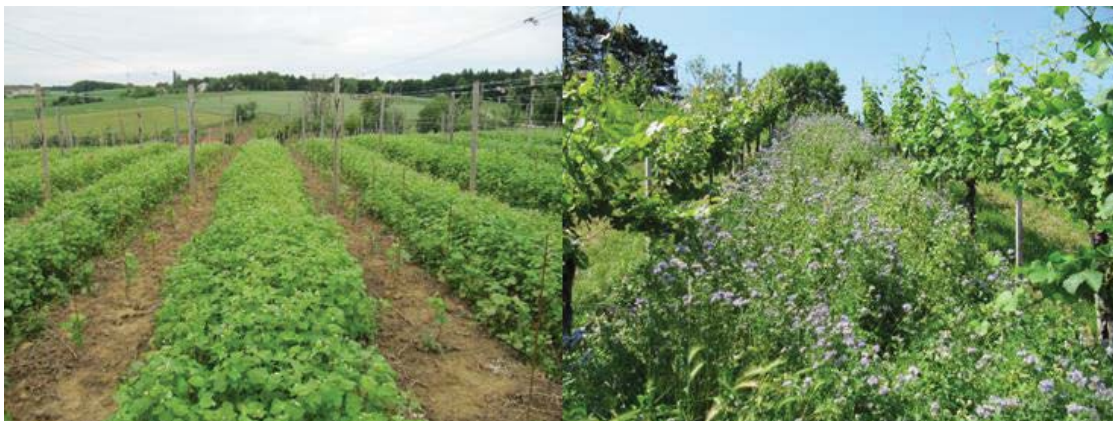
Slika 3 Zaščita tal pred erozijo in obogatitev tal z organsko snovjo s setvijo podorin. Na sliki levo ajda v mladem vinogradu, desno facelija v starem vinogradu.

rastlinsko maso pograbi z brežin v medvrstni prostor ali pod trte. Z načrtnim rahljanjem tal (groba obdelava) od zadnje dekad aprila do prve dekad maja pospešimo mineralizacijo dušika, da je trti na voljo do cvetenja in v juliju za rast mladik in jagod.