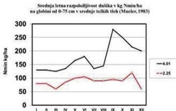
Slika 2: Prikaz srednje letne razpoložljivosti dušika v kg/ha v srednje težkih tleh glede na odstotek organske snovi v tleh

Ponudbo dušika lahko v veliki meri uravnavamo tudi z ustrezno oskrbo tal. To pomeni, da v času manjših potreb vinske trte po dušiku z ozelenitvijo zmanjšamo izgube dušika iz padavin in mineralizacije z ozelenitvijo. Ko pa nastopijo večje potrebe po dušiku, pa konkurenco podrasti zmanjšamo na minimum z mulčenjem, spomladi celo v kombinaciji z grobim rahljanjem. Na ta način so izgube dušika manjše, ponudba dušika pa prilagojena potrebam vinske trte. Zato se pri pomanjkanju dušika v tleh najprej vpeljejo ukrepi za povečanje organske snovi v tleh. To so setev rastlin za kratkotrajno ozelenitev tal (podorine, slika 1) in rastlin za trajno ozelenitev ter pokrivanje tal (zastiranje) z organsko snovjo (slama).