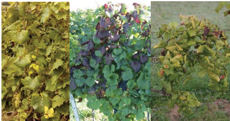
Slika 7: Splošna bledikavost, rumenenje listov pri belih sortah, rdečenje pri rdečih sortah, zvijanje listnih robov navzdol.

Imetniki vinogradov naj pozorno pregledujejo vinograde v času po cvetenju trte, predvsem pa v juliju, avgustu in septembru. V primeru suma je treba poklicati lokalnega fitosanitarnega inšpektorja ali strokovnjaka za varstvo rastlin na lokalnem kmetijsko gozdarskem zavodu ali inštitutu ali UVHVVR. Pozornost je potrebna predvsem v primeru, če se v vinogradu povečuje število simptomatičnih trt!