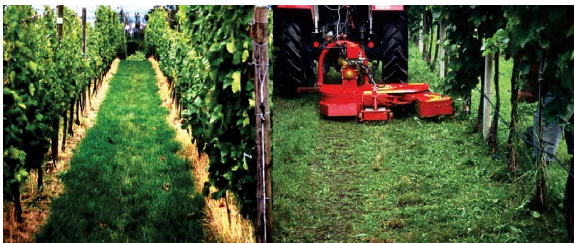
Slika 6: Zatiranje plevelov z uporabo herbicidov v vrsti pod trsi (levo) in mehansko zatiranje plevelov z odmičnim mulčerjem

Oskrba tal v vrsti je usmerjena v zaviranje razvoja močno rastočih plevelov in trav. Cilj oskrbe je usmerjanje razvoja plevelov in trav in ne uničevanje zelenega pokrova, zato se mora herbicid vedno aplicirati samo na rastline in ne na gola tla. Z na hitro odmrli rastlinskimi deli se poveča količina organske snovi, kar zmanjša negativne učinke herbicidov na življenje v tleh. Uporabimo lahko le herbicide, ki so navedeni v smernicah za integrirano varstvo vinogradov.