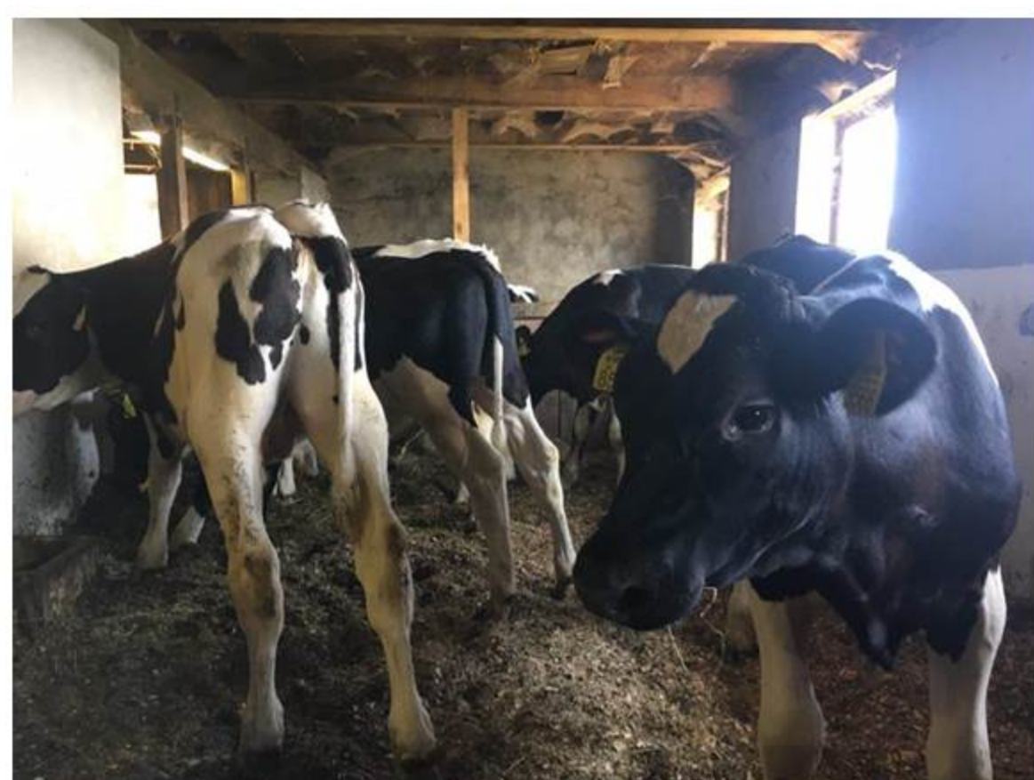
Slika 1: Poskusno pitanje telet - bikcev mlečne pasme.

Zaključek: Pri vsakem rejcu načrtujemo dva pitovna poskusa. Prvi poskus smo zaključili pri treh rejcih. Pri ostalih je prvo poskusno pitanje v teku. V prvem poskusnem pitanju zastavljenih parametrov ne bomo dosegli pri vseh rejcih, v drugem, ponovljenem pitanju pa pričakujemo, na podlagi korekcij tehnologije, doseganje zastavljenih ciljev v celoti. V naslednjem 6-mesečju so načrtovane že prve deseminacije znanja za rejce.